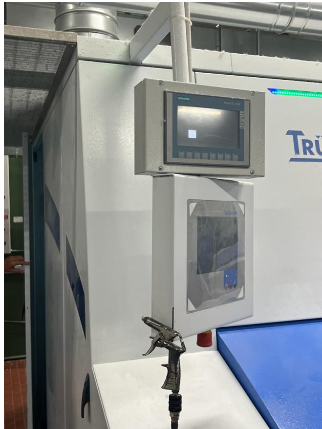
Foto 4 – Imagem do painel de controle da máquina de carda TC11, marca Trützschler.