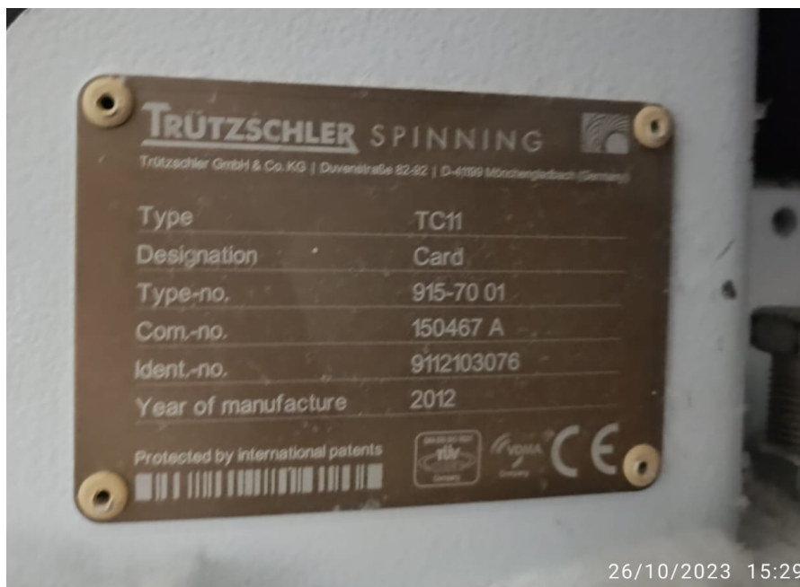
Foto 1 - Placa de Identificação do Equipamento com marca, tipo, modelo, ano de fabricação e número de série.