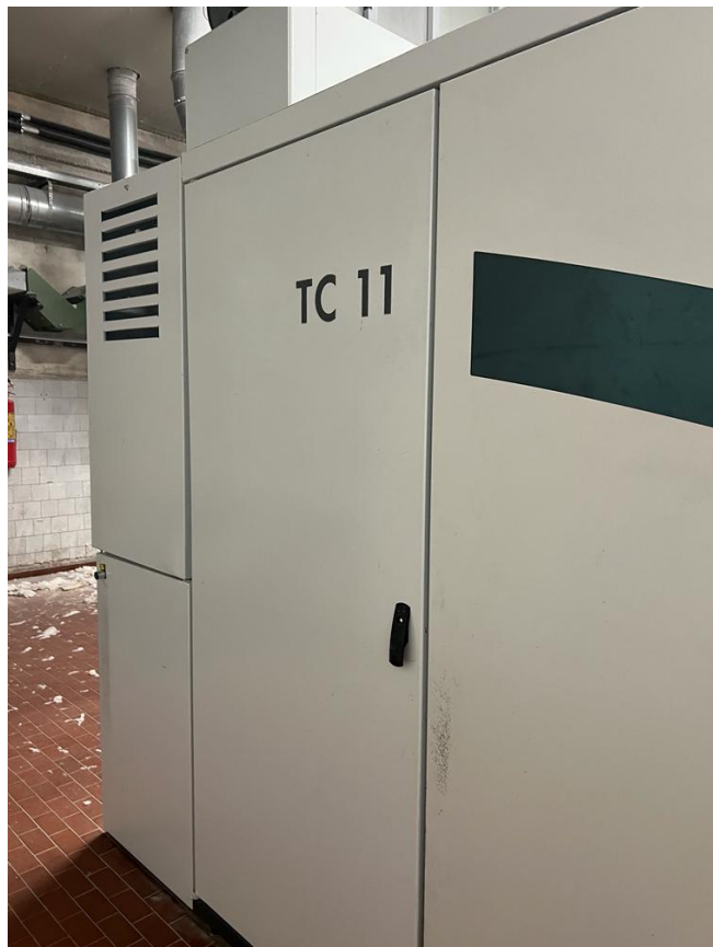
Foto 3 – Imagem da lateral da máquina de carda TC11, marca Trützschler.